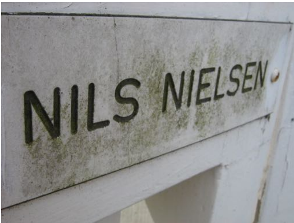
Bild 7. Namnskylten hänger fortfarande kvar utanför huset i Åkarp