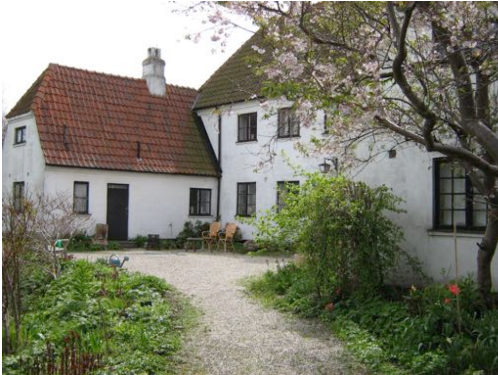
Bild 4. Hemmet i Åkarp i dag.